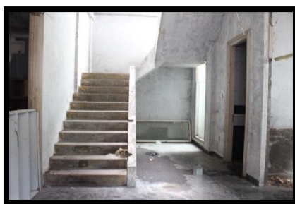
Menuju lantai 2