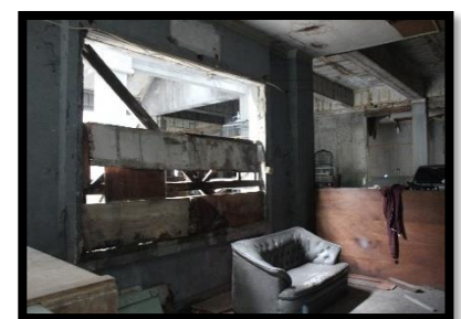
Lorong menuju kedalam